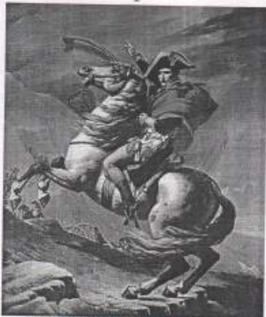
Бонапарт на перевале Гран-Сен-Бернар. 1801. Ж.-Л. Давид