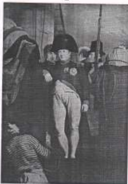
Наполеон на борту английского корабля «Беллерофон». 1815. Чарльз Лок Истлейк