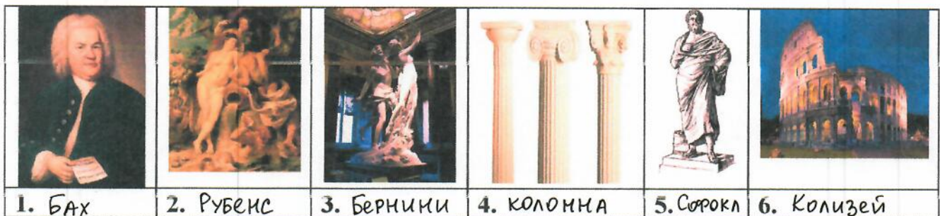
Таблица к заданию 1.

рбиенни лконона бха сфолок убренс зейколи